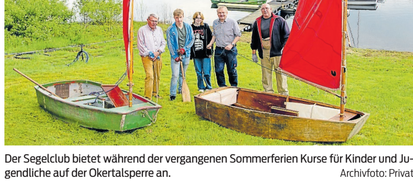
Der Segelclub bietet während der vergangenen Sommerferien Kurse für Kinder und Jugendliche auf der Okertalsperre an.

Für die Trilogie selbst zieht der „Gipfelbasilisk“ eine klare Grenze: „Nach Band drei ist definitiv Schluss.“ Stattdessen möchte er neue Geschichten erzählen. „Mein nächstes Projekt, an dem ich demnächst den finalen Entwurf schreiben werde, ist eine Horrorgeschichte. Die spielt auch hier im Harz.“